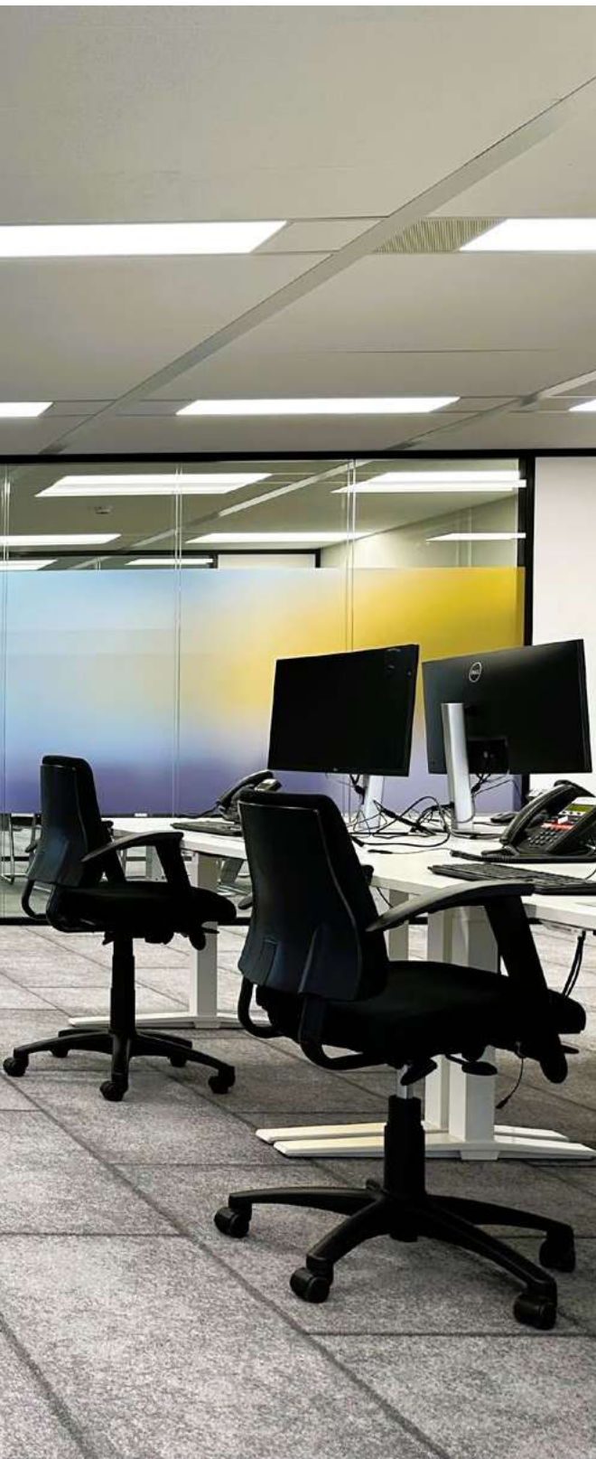
Odido, Pays-Bas ▶