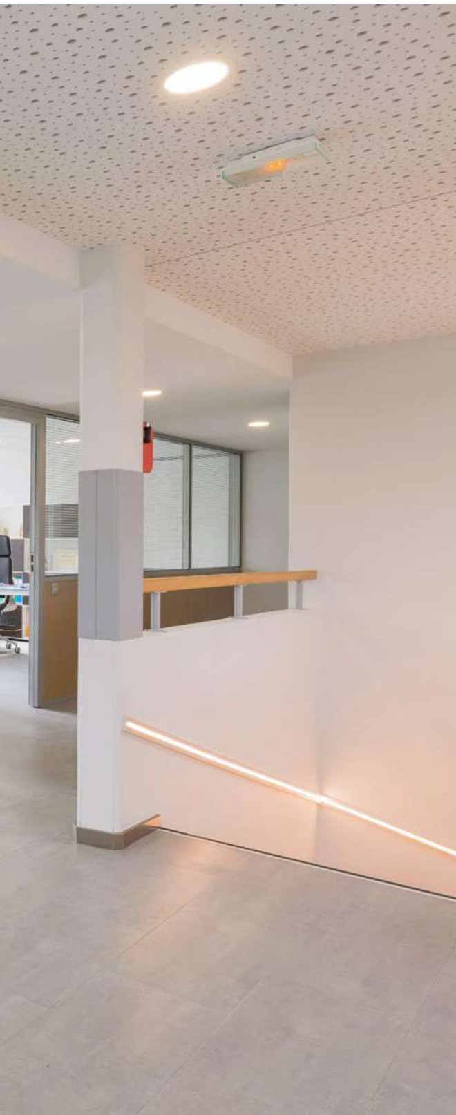
Reatech, Strasbourg ►