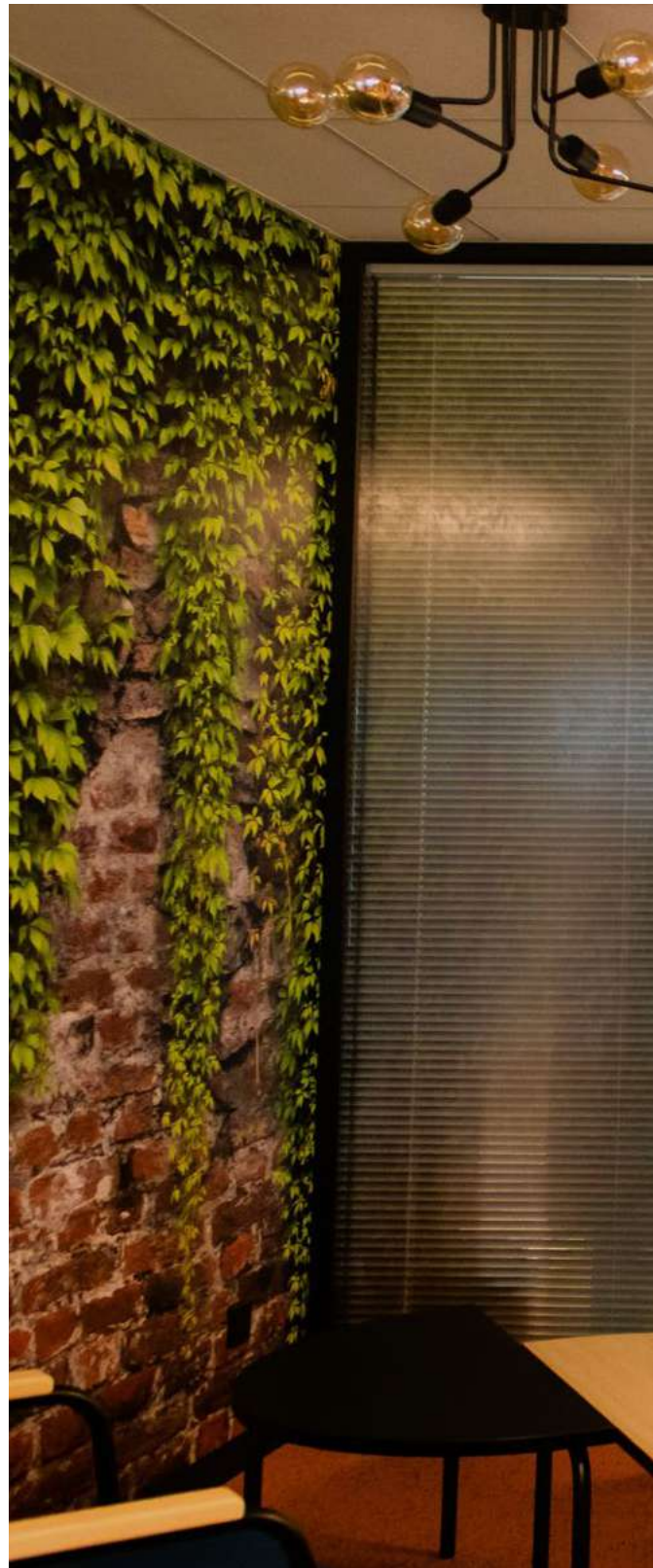
◀ LLA Experts Comptables, Caen